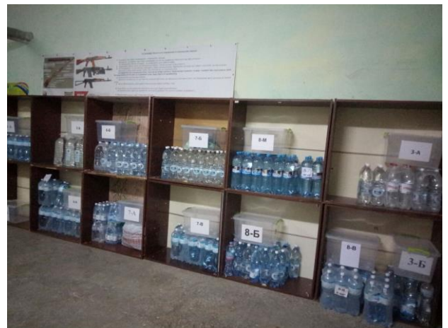
Найпростіше укриття (запаси питної води)