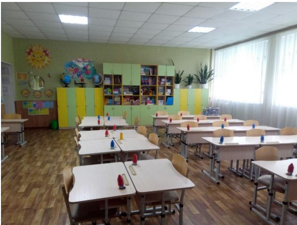
Кабінет початкових класів