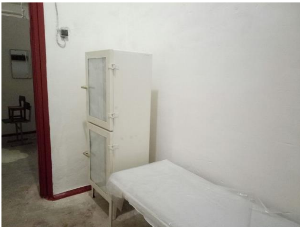
Медичний пункт у найпростішому укритті